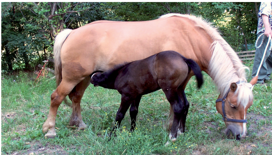
Ricevente avelignese con puledro Quarter Horse - Haflinger recipient with a Quarter Horse foal on her side

Embryo Transfer when used in the mare can offer considerable advantages for the horse breeding industry; nevertheless, if not properly performed can lead to disappointing results