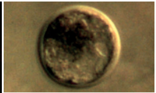
Fig 3. Immagine al microscopio di un embrione equino di circa 7 giorni (blastocisti precoce) - Picture showing 7 days equine embryo (early blastocyst)