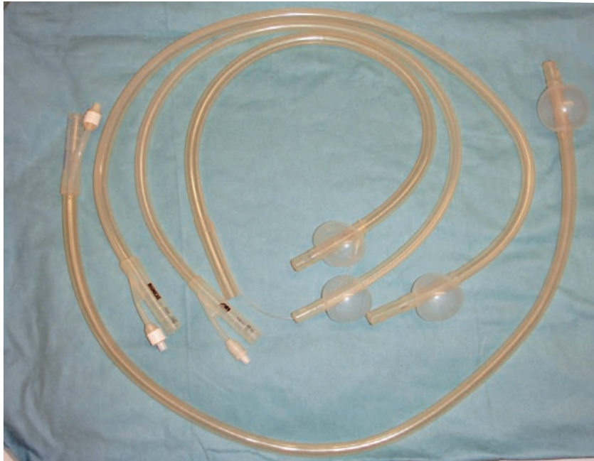
Fig 2. Nella figura sono rappresentati 4 diversi tipi di catetere. Il palloncino all'estremità è insufflato per una migliore identificazione. Picture showing for different catheter. The balloon on the tip are inflated for a better representation.

cessivo consiste nel recuperare, utilizzando sempre la stessa sonda, la soluzione precedentemente introdotta nell'utero.