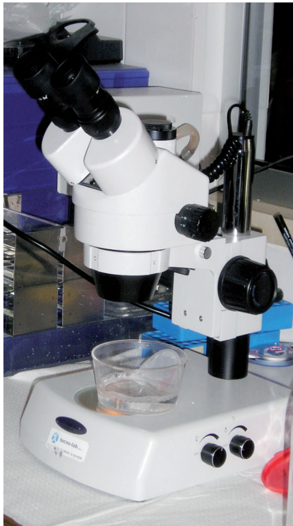
Stereomicroscopio con filtro durante la fase di ricerca dell'embrione. Stereomicroscope and filter during the embryo search

Another good reason for shipping embryos to a recipient herd facility is because most of donor mare owners prefer to rent a recipient from reproduction